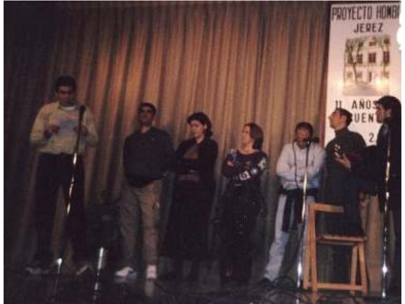
Participación de los internos del Centro Penitenciario de Puerto II en los actos de celebración del XI aniversario de Proyecto Hombre en la Provincia de Cádiz